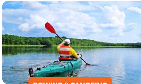
ROWING & CANOEING