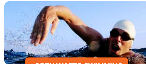
OPEN WATER SWIMMING