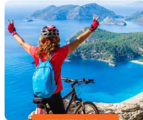
ESPORTS A MIDA