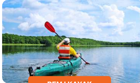
REM I KAYAK