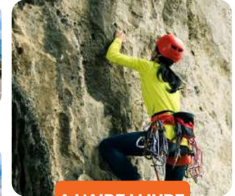
A L'AIRE LLIURE